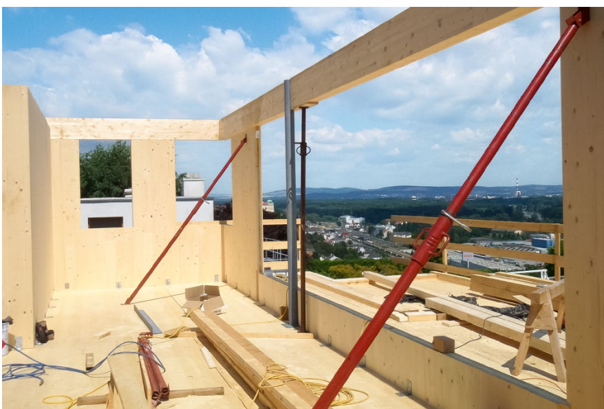
Wohnbau in Holzbauweise, Klosterneuburg; Planung: Architekturbüro Reinberg