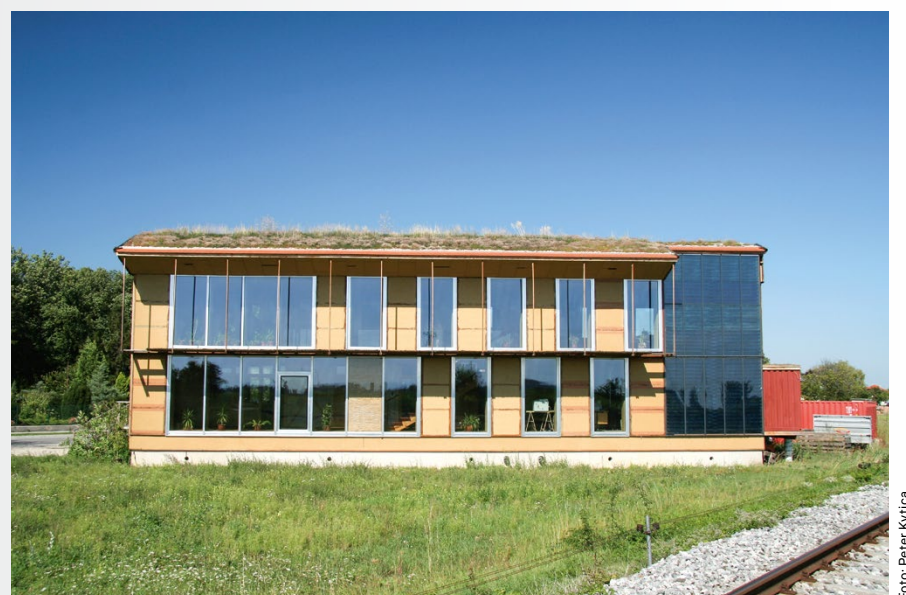
Bürobau in Tattendorf mit sehr hohem Holzanteil; Planung: Architekturbüro Reinberg und Roland Meingast

Mögliche Lösungsansätze für eine zirkuläre Holznutzung in der Bauwirtschaft wurden im Projekt für alle Lebenszyklusphasen von Gebäuden und Bauteilen ermittelt. Bei der Herstellung von Holzbauprodukten stehen hier neben der Verwendung von Altholz die Nutzung von Rinde in Isoliermaterialien und Brettsperrholzdecken mit reduzierten Bauteildicken im Vordergrund. In der Planungsphase ist der Fokus auf sortenreines Bauen im Trockenbau essenziell, um einen späteren Rückbau und die Wiederverwendbarkeit der Teile zu erleichtern. Für die Nutzungsphase sollte eine lückenlose Aufzeichnung von Informationen wie Schadereignissen, Schadstoffeinträgen und Lathistorie erfolgen, wofür noch praxistaugliche Formate gefunden werden müssen. Beim Rückbau sollten Pre-Demolition-Audits mit Fokus auf Reuse durchgeführt werden. Außerdem ist die gezielte und möglichst